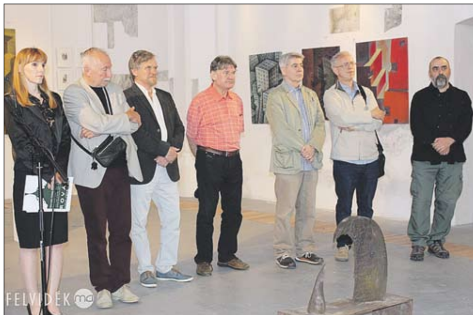
Vystavujúci umelci tvorivej komunity Rovás