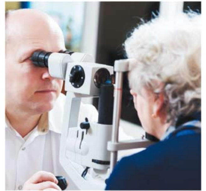
Pravidelné kontroly diabetikov u očného lekára znížia riziko slepoty až o polovicu.

Bezplatne sa dá objednať k očnému lekárovi, k neurológovi, k nefrológovi a k angiológovi. Len menej ako polovica diabetikov v našom regióne má totiž za sebou potrebné očné vyšetrenie, hoci každý jeden diabetik je ohrozený slepotou a k očnému by mal zájsť aspoň raz za rok. Riziko vážneho poškodenia zraku tak zníži až o polovicu. Rovnako kontrolné vyšetrenie u neurológa v našom regióne nemá za sebou ani jedna tretina pacientov s cukrovkou!