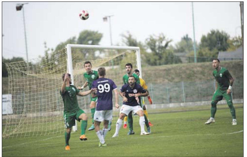
A legtöbb támogatást a KFC klub kapta, viszont a testület kikötötte, hogy csak a fiatalokra, az utánpótlás nevelésére költhetik a támogatást

„Kiemelt cél, hogy a támogatások nagy része a komáromi és a fiatal sportolókra legyen elkölthető. A KFC esetében a testület kikötötte, hogy csak a fiatalokra költhetik a támogatást. Bízunk benne, hogy egyre több komáromi fog sportolni és a gyerekeknek is biztosítva lesz a tartalmas kikapcsolódás”