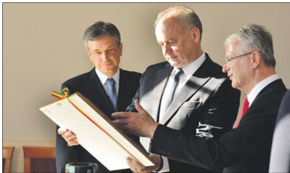
Andrej Kiska köztársasági elnököt a városháza nagytermében fogadta Stubendek László polgármester és Keszegh Béla alpolgármester

A látogatás a városházán folytatódott, ahol város vezetőivel, az egyetem rektorával és az osztályvezetőkkel tárgyalt a hét tagú elnöki csapat. Andrej Kiska a város gazdasági és társadalmi kérdéseiről érdeklődött. Stubendek László polgármester az erődre hívta fel Kiska elnök figyelmét, amelyben folyamatos a felújítási