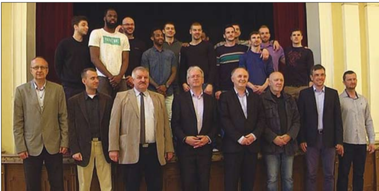
Az ezüstérmes kosarások és a város vezetői az ünnepi fogadást követő csoportfotón

Az ezüstérmes komáromi kosárlabdacsapat játékosait, menedzserét, edzőjét köszöntötték a város vezetői a Tiszti pavilonban.