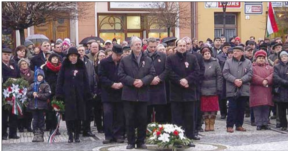
A két Komárom polgármestere együtt tisztelgett a márciusi ifjak emléke előtt