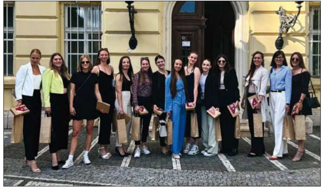
A VK Spartak UJS Komárom felnőtt női röplabdacsapata

Történelmi siker – röviden így jellemezhetnénk azt a hatalmas, évekkel ezelőtt