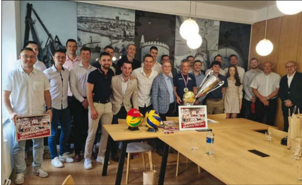
A VK Spartak UJS Komárom felnőtt férfi röplabdacsapata

Eseménydús volt az elmúlt időszak városunk sportéletében. A hagyományoknak megfelelően a tavalyi évben legjobb teljesítményt nyújtó sportolókat és klubokat jutalmazta városunk önkormányzata, valamint a komáromi röplabda- és labdarúgócsapat is olyan történelmi sikereket ért el, amely nemcsak a sportkedvelő közönség, de a város részéről is méltó dícséretet és elismerést érdemel.