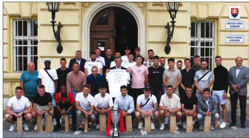
A Komáromi Football Club felnőtt férfi csapata

döntőjébe, és ott voltak az európai Challenge Kupa nyolcaddöntőjében is, ami szintén hatalmas siker a ha-