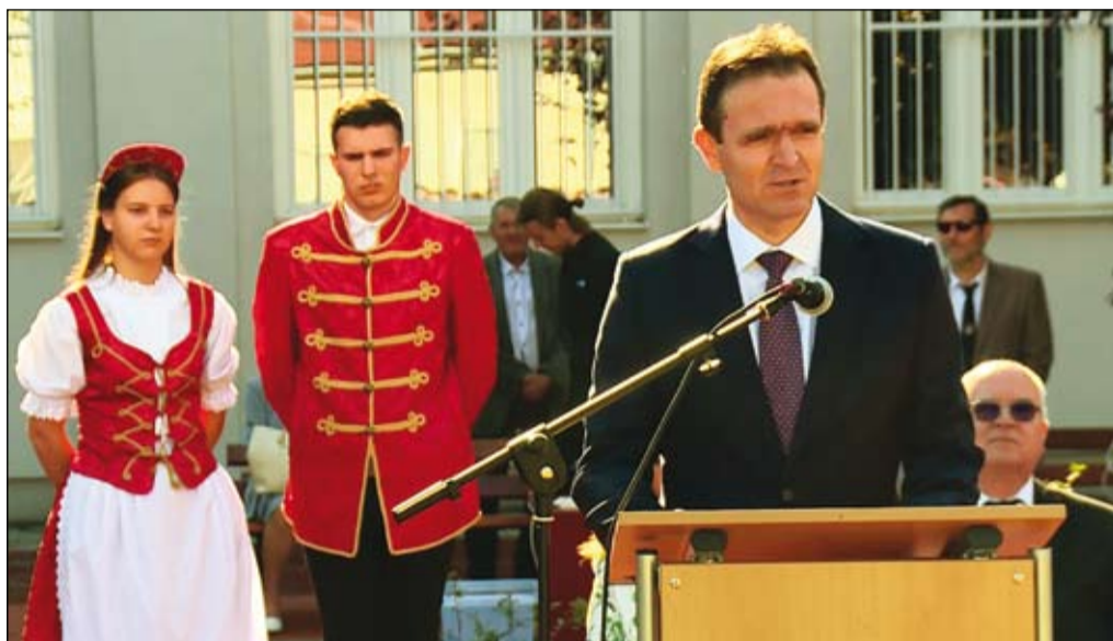
A tanévnyitó napján Ódor Lajos miniszterelnök egykori iskolájában, a Selye János Gimnáziumban köszöntötte a tanárokat és a diákokat.

– Az óvodák esetében közel 900 gyermekről van szó, akik most léptek be az óvodai képzésbe. A városban működő középiskolákat közel 1500 diák látogatja. Ami viszont az önkormányzathoz legközelebb áll, azok az alapiskolák, bár itt is vannak egyházi fenntartású intézmények. A városban működő alapiskolákban 2900 gyermek kezdte meg az új tanévet. Az önkormányzat az oktatásügy terén elsősorban arra összpontosít, hogy modern, felújított épületekben, a lehető legjobb körü-