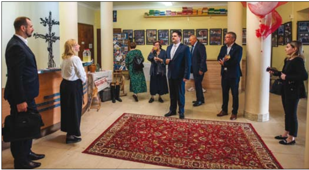
Ministerka Silvia Hroncová spolu s delegáciou ministerstva kultúry navštívila aj Dom Matice slovenskej a Miestny odbor Matice slovenskej v Komárne