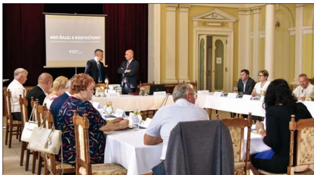
Minister financií Michal Horváth sa počas svojej návštevy v Komárne stretol s primátormi a starostami nášho regiónu

– Súčasná vláda si veľmi konkrétne osvojila naše návrhy, takže vidíme, že na jednej strane v oblasti priamych grantov existuje konštruktívny prístup. Je dobré, že vôbec existuje nejaký priestor pre priame granty, a tak môžeme získať nejaké finančne vhodné riešenia. Najdôležitejšie je, že pracujeme aj na tom, aby sa naše výdavky, teda naše záväzky znížili. Ak nemúsime na niečo míňať, môžeme dosiahnuť úspory a nemúsime nevyhnutne zvyšovať deficit verejných financií. Súčasná vláda je v tomto smere pre